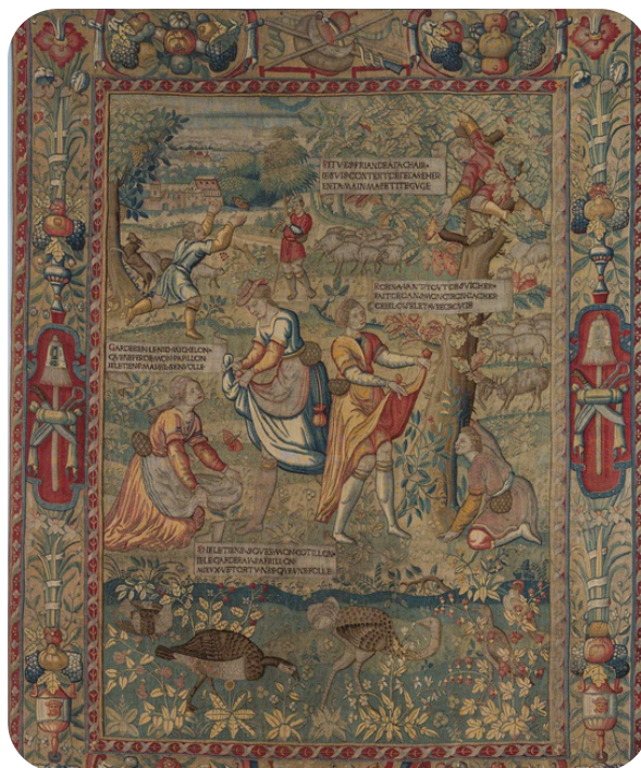
Tenture des Amours de Gombault et Macée, La chasse aux papillons

Tout public | Durée : 1h40 Sur Inscription