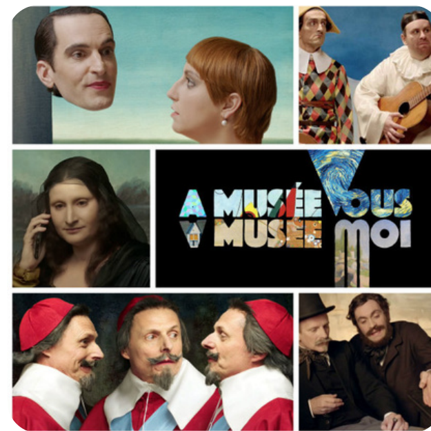
A musée vous, A musée moi

OUVERTURE TOUT PUBLIC TOUT LES JOURS DE LA SEMAINE de 10h30 à 19h